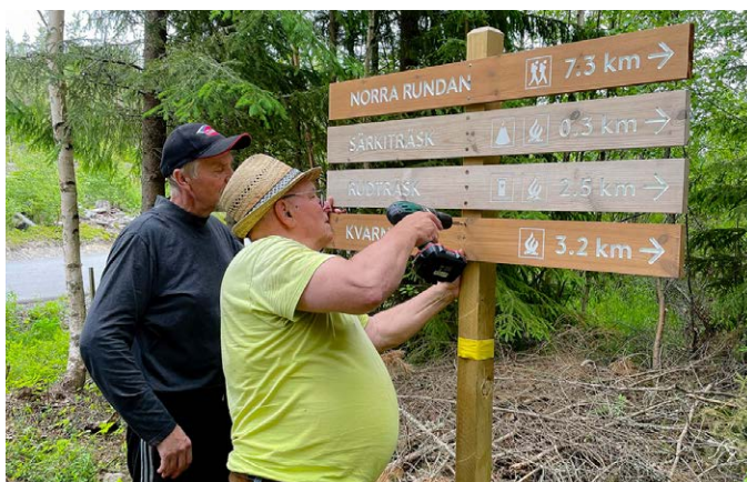
Stor vikt har lagts vid en välfungerande och god skyltning.