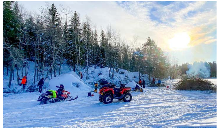
Frakt av spångvirke ut på Källmossen samt avverknings- och materialfraktstälko på Kvarnträsk vintern 2021.

Samtidigt skulle transport av spångvikre ske ut på Källmossen, där 650 meter spång skulle byggas och även den fjärde grillplatsen. Transporterna skedde med snöskoter, slädar samt fyrhjulingar och under flera helger. Vid Kvarnträsk hölls flertalet avverknings- och röjningstälkon, innan bygget av grillplatsens terrass kunde påbörjas under vårvintern. Detta pågick tills isen återigen blev för tunn att gå på.