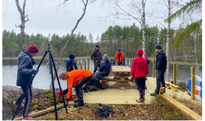
Bygge av ledens tredje grillplats - terrassen vid Kvarnträsk - pågick både före och efter islossningen.

Under våren, efter att snön smält, färdigställdes grillplatsen vid Kvarnträsk. Samtidigt röjdes den sista delen av ledens norra runda upp och spångar byggdes på de delar där det behövdes. När även skyltningen var klar på den här delen av leden, kunde Norra rundan öppnas för "trafik" i början på sommaren.