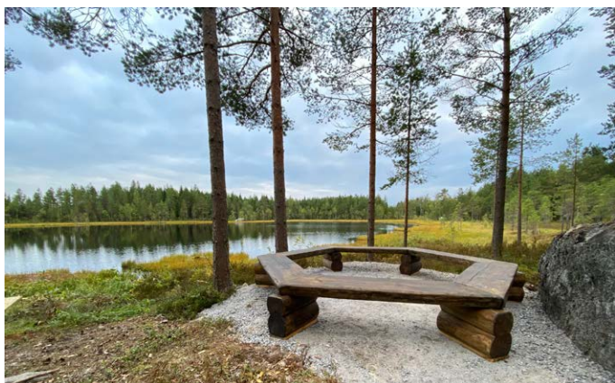
Vedtak och bänkar på plats vid Särkiträsk.

Trycket från allmänheten att kunna börja använda leden ökade vartefter under hela hösten vartefter ryktet om projektet spred sig. Talkotillfällen ordnades gruppvis 2-3 kvällar hela hösten fram till tidsomställningen i oktober då kvällarna blev för mörka. Även andra faktorer påverkade arbetet, bland annat höstens orimliga regnmängder, och ledde till att talkoarbetet pausades fram till advent. Först då hade de stora vattenmängderna gett vika i skogen och arbetet med projektets första etapp kunde slutföras.