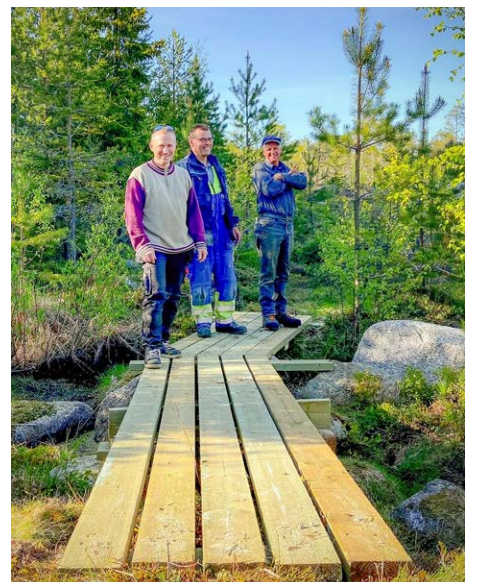
Kvarnträsk grillplats samt röjning och spångbygge på Norra rundan färdigställdes våren 2021.